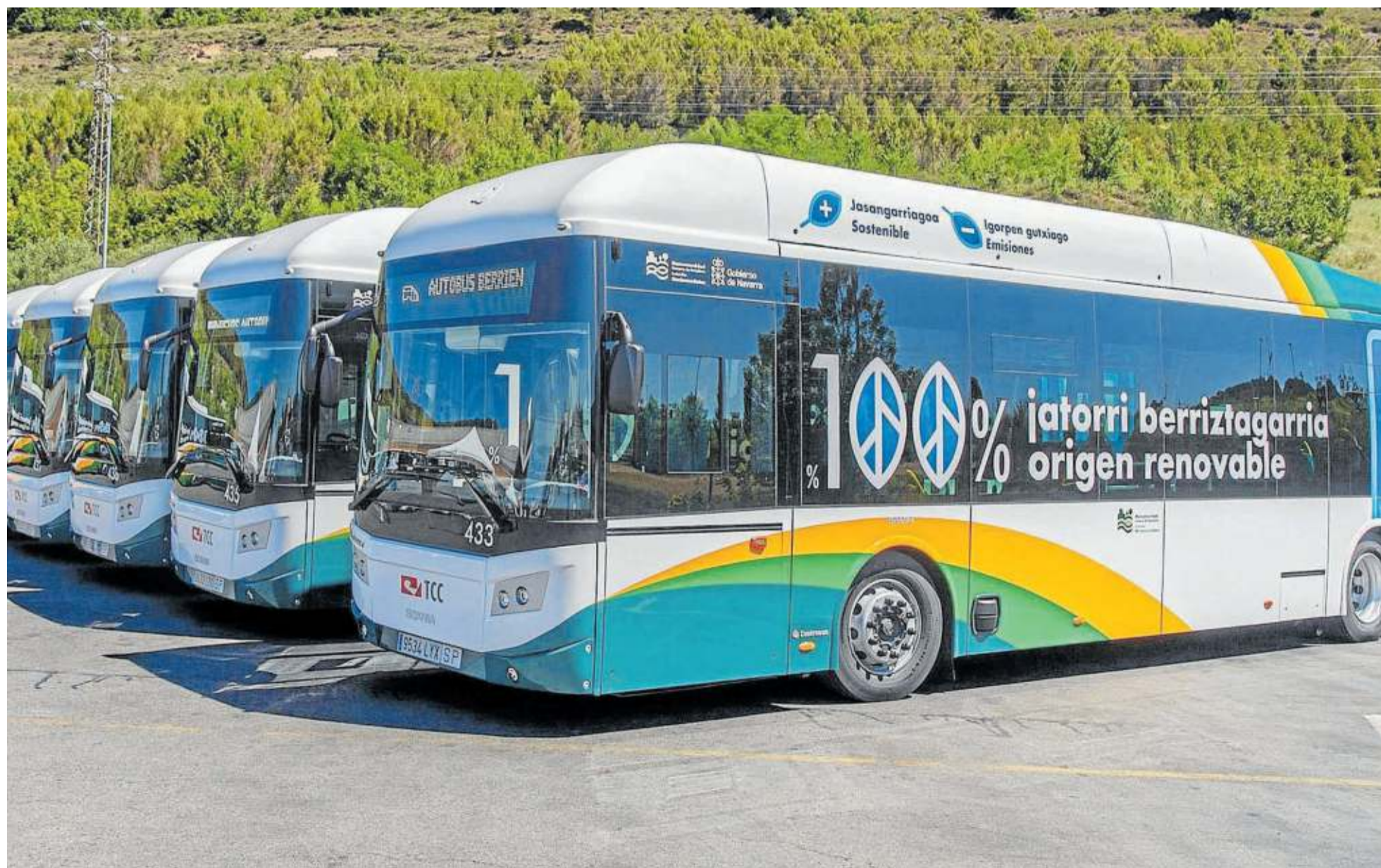
Imagen correspondiente a la presentación de los trece autobuses de Gas incorporados en 2022.

De hecho, desde que en el año 2014 la mancomunidad comenzara a medir y a certificar la huella de carbono de sus servicios, el impacto de esta en el Transporte Urbano Comarcal se ha reducido ya un 16%