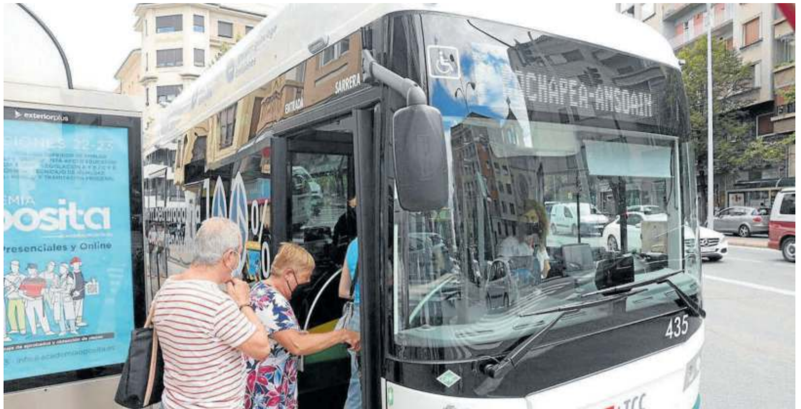
Usuarios haciendo uso de una villavesa que contribuye a la movilidad sostenible. UNAI BEROIZ

La ejecución de medidas innovadoras por parte de TCC Pamplona la han posicionado como una empresa pionera en materia medioambiental, pero la gestión va más allá. En 2021, la compañía recibió el reconocimiento de sus usuarios con el mejor índice de satisfacción de la historia de las villavesas y este año se ha alzado con el premio a Mejor Empresa del Año en categoría de Transporte Urbano.