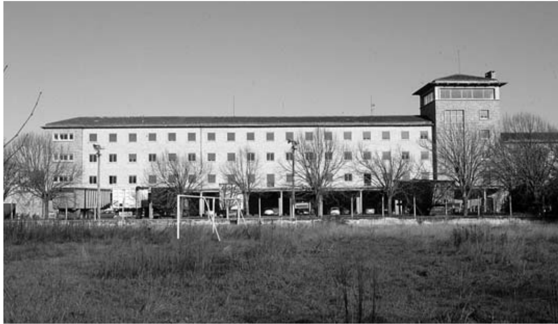
Colegio Agustinos, cerrado desde 2008, cuyo solar sería el futuro "hogar" de las villavesas.