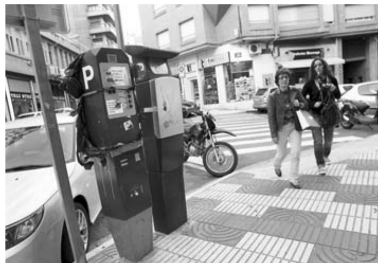
Máquinas expendedoras de tickets de la zona azul tudelana.

La vuelta al trabajo de este empleado generó ayer por la mañana un incidente. Según las fuentes consultadas, sus compañeros en huelga le siguieron durante parte de su jornada con un megáfono. La Policía Municipal pidió a estas personas que lo dejaran porque estaban perturbando la conviven-